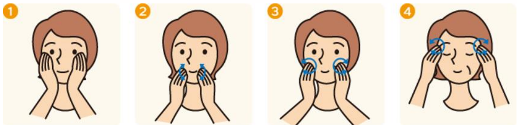
顔全体を両方の手で覆う。